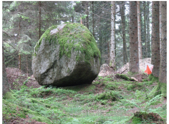
Bilder aus dem Laufgelände in Schonach